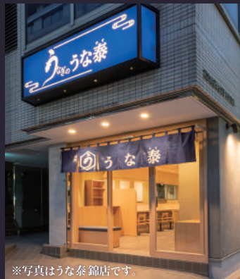
※写真はうな泰 錦店です。